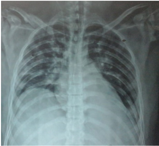
Imagen 1. Radiografía anteroposterior de tórax al ingreso. Se evidencian infiltrados alveolo-intersticiales difusos bilaterales.